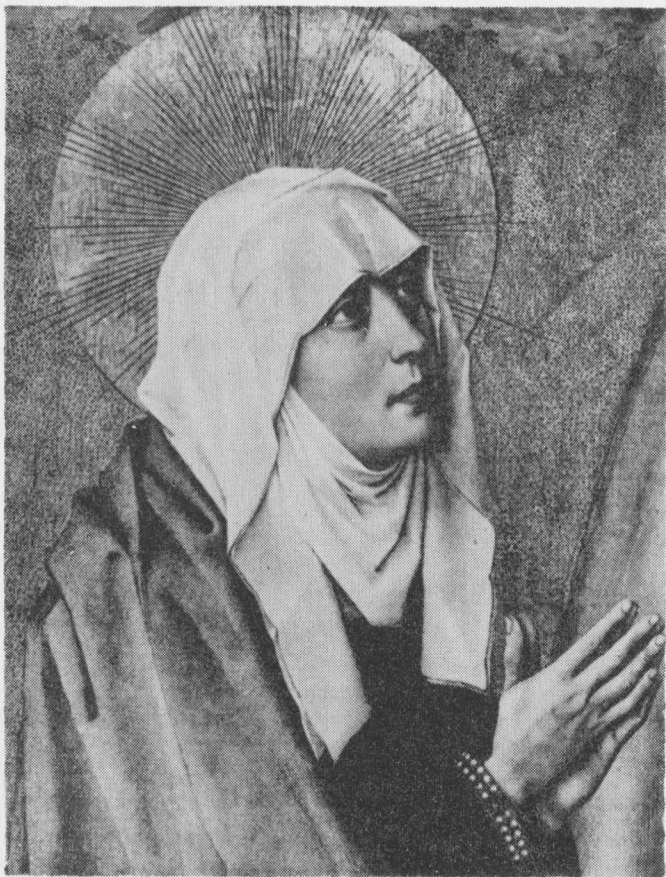
Rogier van der Weyden