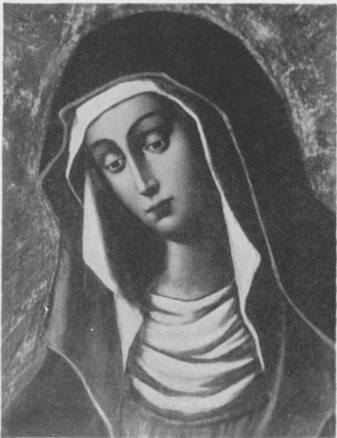
Aušros Vartų Marija Vilniuje